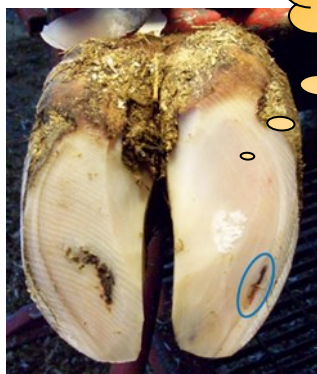
Witte lijn defect